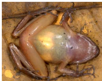
34 Oreobates gemcare STRABOMANTIDAE