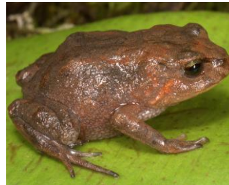
27 Bryophryne nubilosus STRABOMANTIDAE