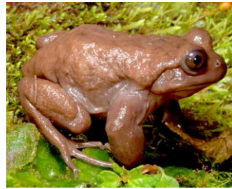
7 Telmatobius mendelsoni CERATOPHRYIDAE