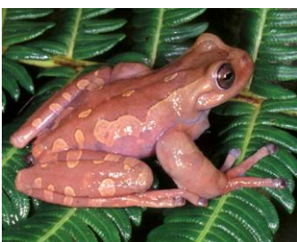
17 Hyloscirtus armatus ♂ HYLIDAE