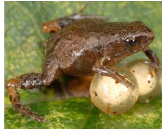
31 Noblella pygmaea ♀ STRABOMANTIDAE