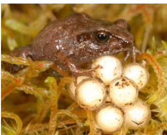
37 Psychrophrynella usurpator ♂ STRABOMANTIDAE