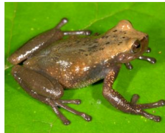
11 Gastrotheca antoniichoai ♀ HEMIPHRACTIDAE