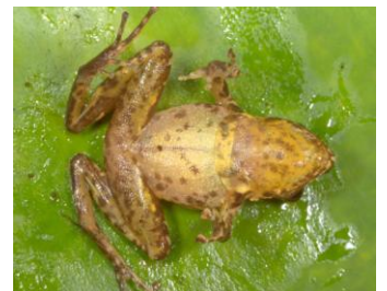
36 Pristimantis pharangobates STRABOMANTIDAE