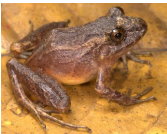
33 Oreobates gemcare STRABOMANTIDAE