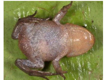
28 Bryophryne nubilosus STRABOMANTIDAE