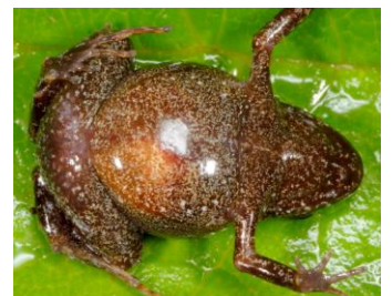
40 Psychrophrynella usurpator ♀ STRABOMANTIDAE