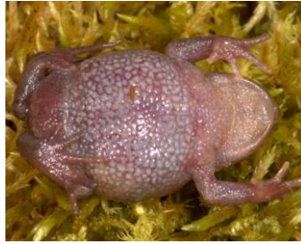
22 Bryophryne cophites STRABOMANTIDAE