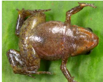
30 Noblella pygmaea ♂ STRABOMANTIDAE