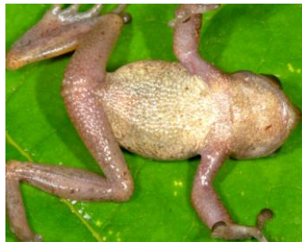
10 Gastrotheca antoniichoai ♂ HEMIPHRACTIDAE