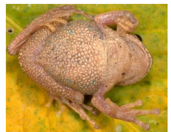
16 Gastrotheca nebulanastes HEMIPHRACTIDAE