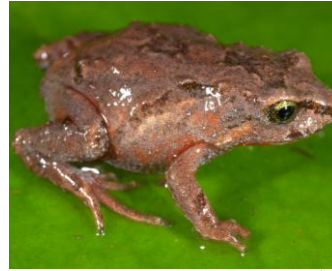
23 Bryophryne hanssaueri ♂ STRABOMANTIDAE