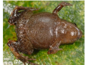
32 Noblella pygmaea ♀ STRABOMANTIDAE