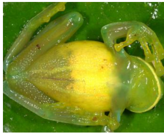
2 Centrolene sabini CENTROLENIDAE