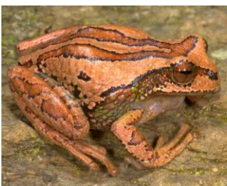
13 Gastrotheca excubitor HEMIPHRACTIDAE