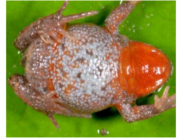
24 Bryophryne hanssaueri ♀ STRABOMANTIDAE