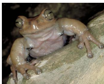
18 Hyloscirtus armatus ♂ HYLIDAE