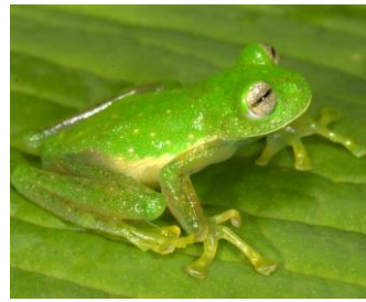
3 Nymphargus pluvialis CENTROLENIDAE