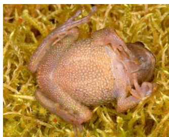
14 Gastrotheca excubitor HEMIPHRACTIDAE