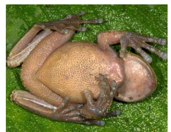
20 Hyloscirtus armatus ♀ HYLIDAE