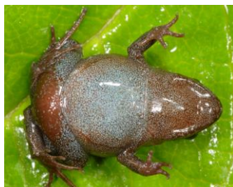
38 Psychrophrynella usurpator ♂ STRABOMANTIDAE