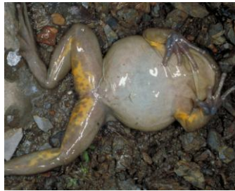
6 Telmatobius timens CERATOPHRYIDAE