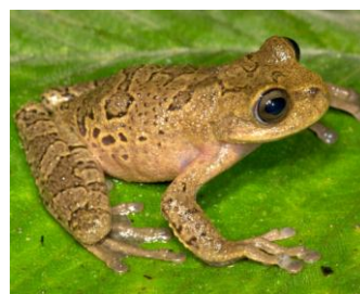
19 Hyloscirtus armatus ♀ HYLIDAE