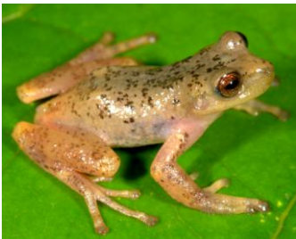
9 Gastrotheca antoniichoai ♂ HEMIPHRACTIDAE