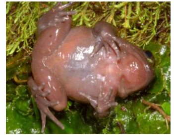
8 Telmatobius mendelsoni CERATOPHRYIDAE