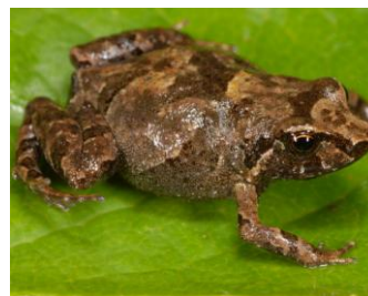
39 Psychrophrynella usurpator ♀ STRABOMANTIDAE