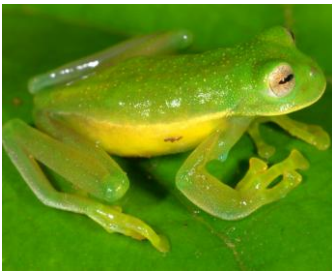
1 Centrolene sabini CENTROLENIDAE