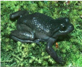
5 Telmatobius timens CERATOPHRYIDAE