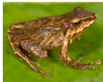
35 Pristimantis pharangobates STRABOMANTIDAE