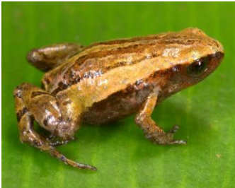
29 Noblella pygmaea ♂ STRABOMANTIDAE