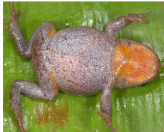
26 Bryophryne hanssaueri ♀ STRABOMANTIDAE