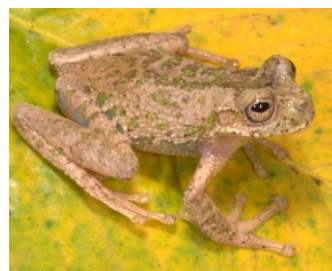
15 Gastrotheca nebulanastes HEMIPHRACTIDAE