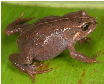
25 Bryophryne hanssaueri ♀ STRABOMANTIDAE