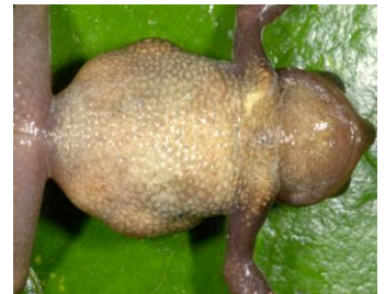
12 Gastrotheca antoniichoai ♀ HEMIPHRACTIDAE