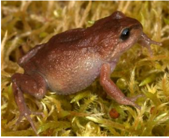
21 Bryophryne cophites STRABOMANTIDAE